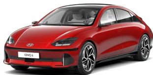
Ultimate Red Metalická Cena: 0 Kč