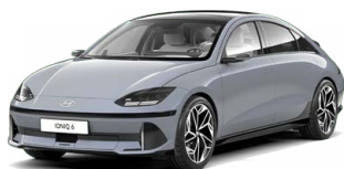
Transmission Blue Perleťová Cena: 19 900 Kč