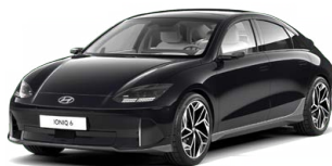
Abbys Black Pearl Perleťová Cena: 19 900 Kč