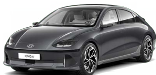
Nocturne Gray Matná metalická Cena: 24 900 Kč